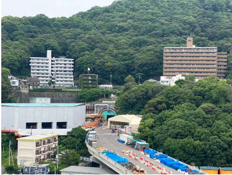
① 高速 5 号線シールドトンネル掘削他工事