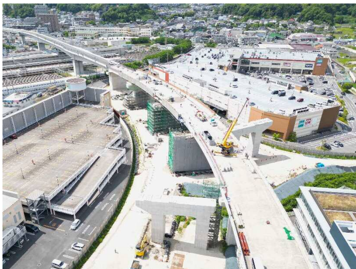
③ 令和 4 年度広島高速 5 号線温品 JCT 下部工事