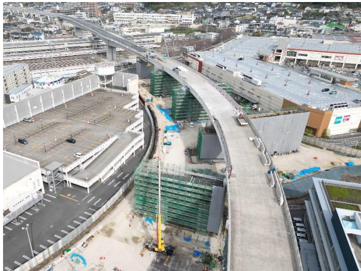
③ 令和 4 年度広島高速 5 号線温品 JCT 下部工事