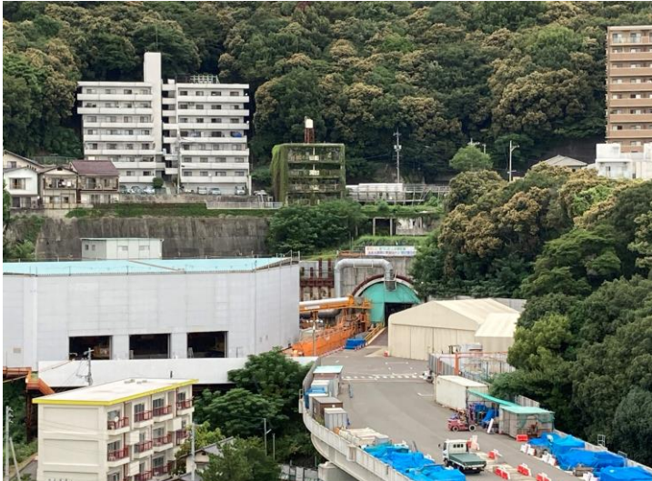
① 高速 5 号線シールドトンネル掘削他工事