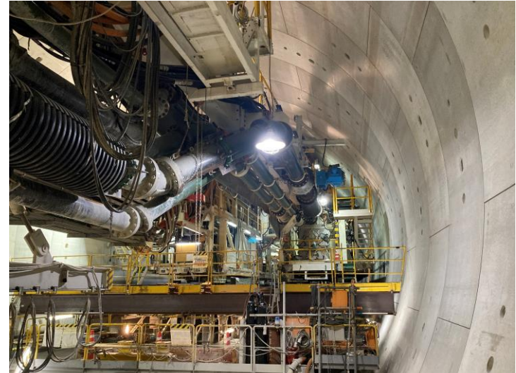
② 高速 5 号線シールドトンネル掘削他工事