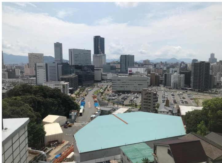
① 高速 5 号線シールドトンネル掘削他工事