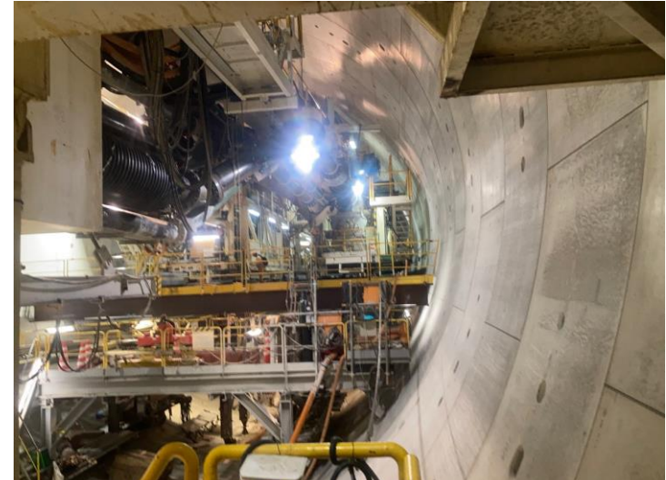
② 高速 5 号線シールドトンネル掘削他工事