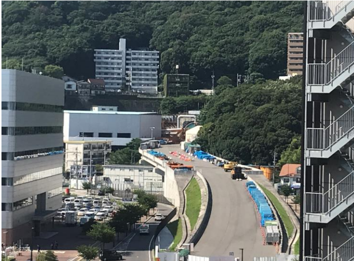
① 高速 5 号線シールドトンネル掘削他工事