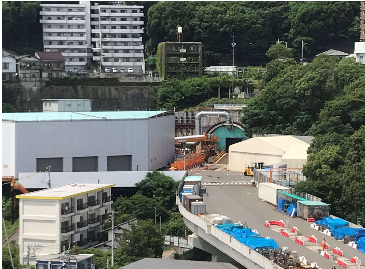
① 高速 5 号線シールドトンネル掘削他工事