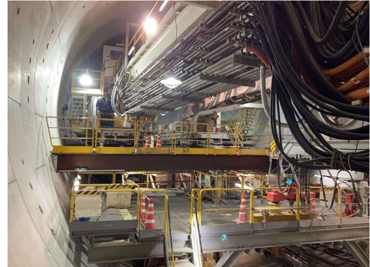
② 高速 5 号線シールドトンネル掘削他工事