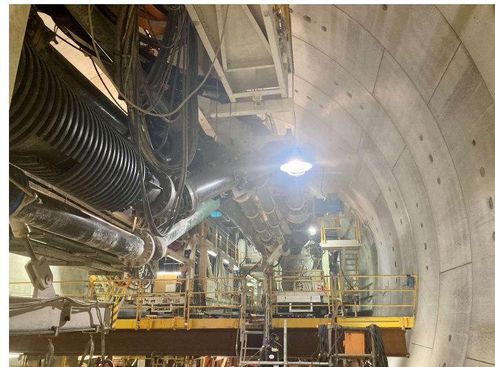
② 高速 5 号線シールドトンネル掘削他工事