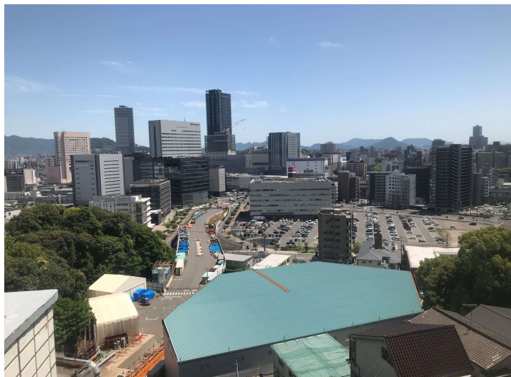
① 高速 5 号線シールドトンネル掘削他工事