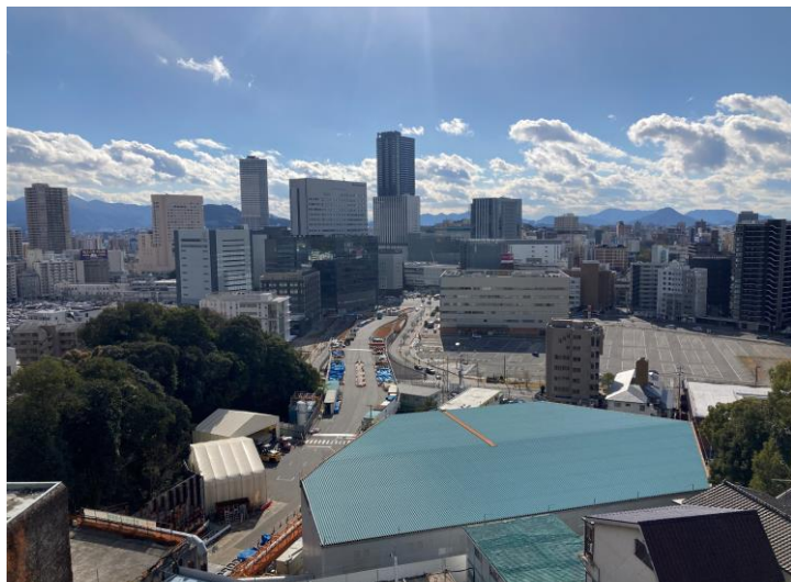
① 高速 5 号線シールドトンネル掘削他工事