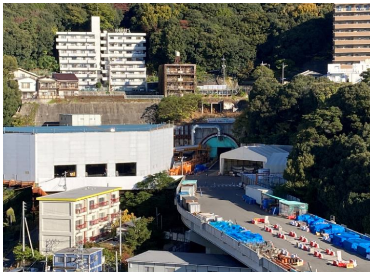
① 高速 5 号線シールドトンネル掘削他工事