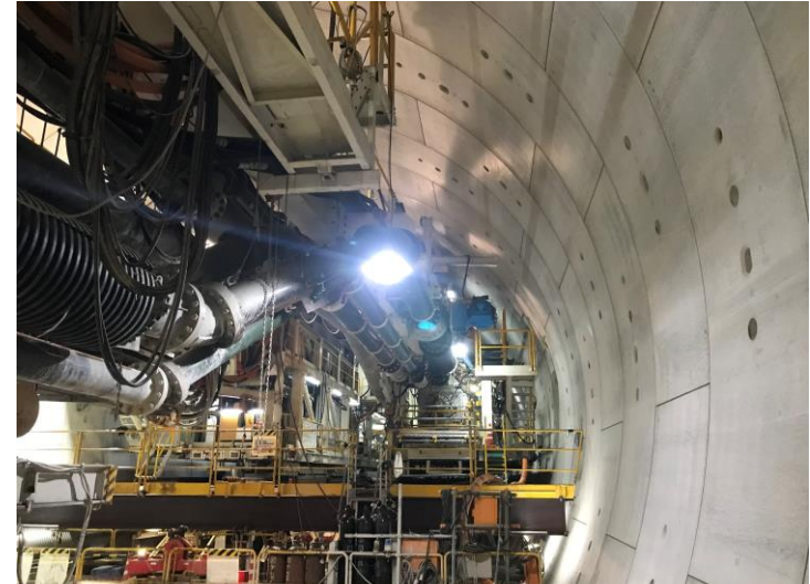
② 高速 5 号線シールドトンネル掘削他工事