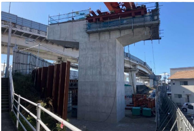
③ 広島高速 5 号線温品 JCT 下部工事 (2 工区)