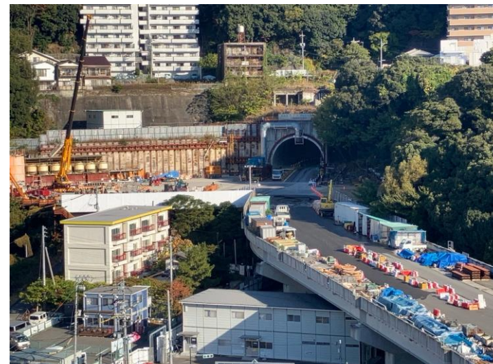
② 高速 5 号線シールドトンネル掘削他工事