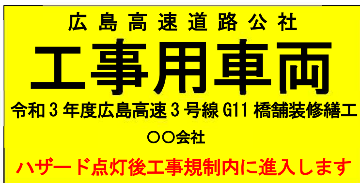
大型車用車両幕 例