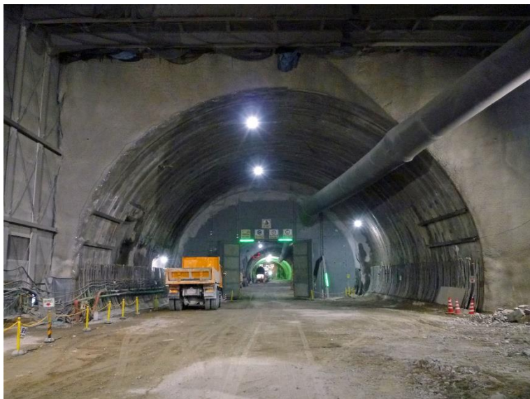
③ 高速5号線 NATM トンネル工事