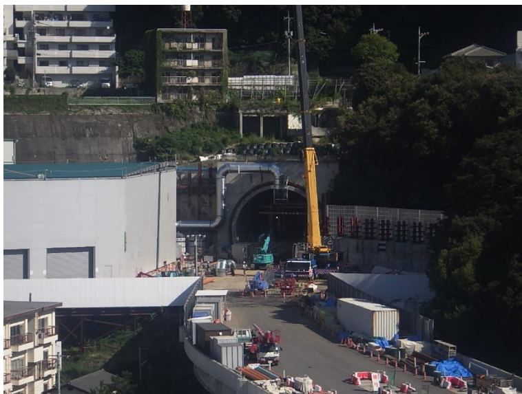
① 高速5号線シールドトンネル掘削他工事