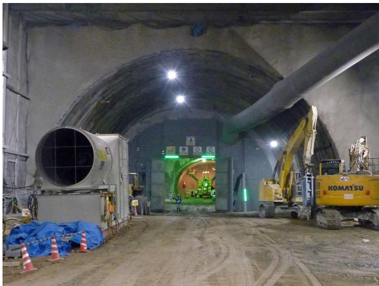
③ 高速5号線 NATM トンネル工事