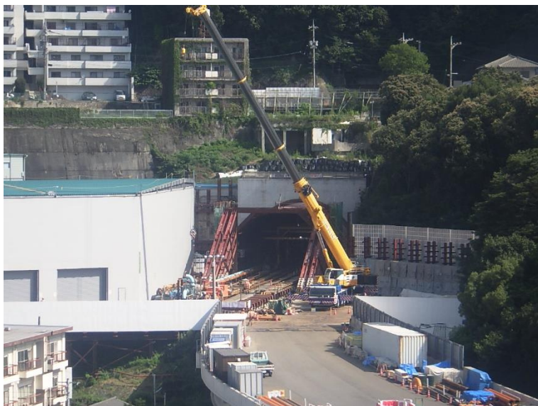
① 高速5号線シールドトンネル掘削他工事