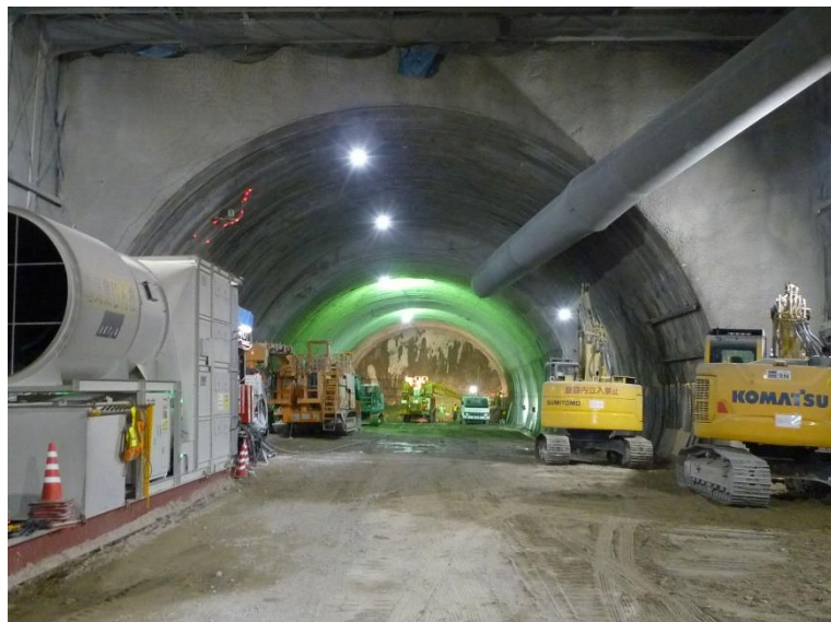
③ 高速5号線 NATM トンネル工事