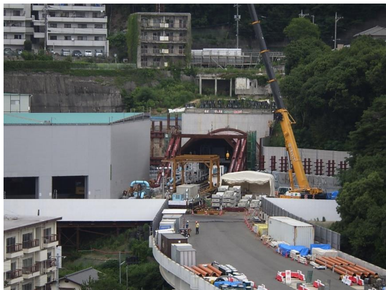
① 高速5号線シールドトンネル掘削他工事