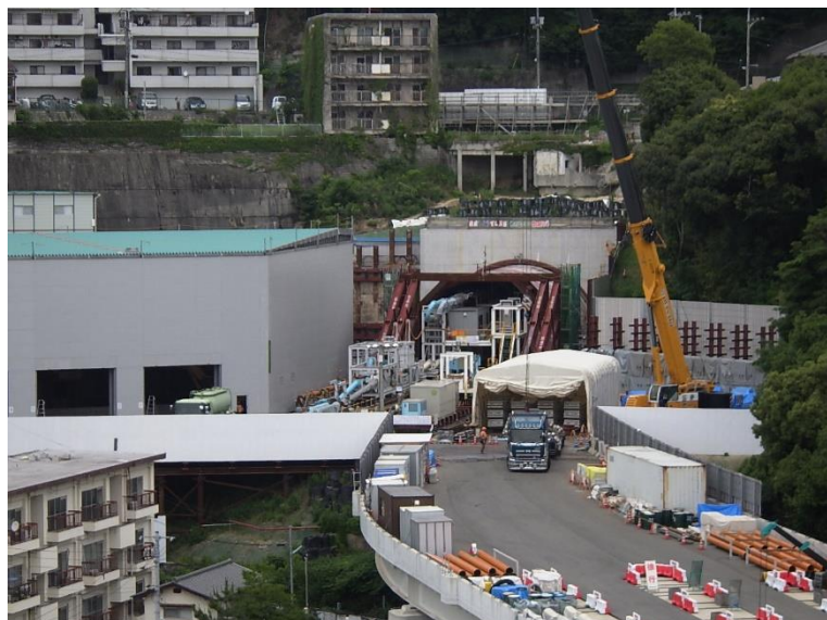
① 高速5号線シールドトンネル掘削他工事