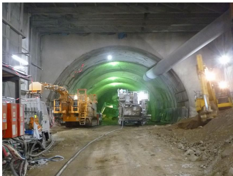
③ 高速5号線 NATM トンネル工事