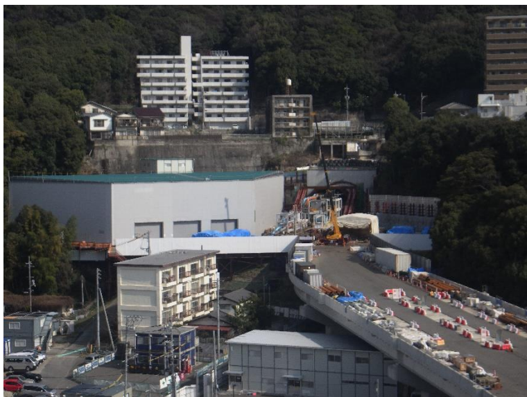
① 高速5号線シールドマシン製作他工事