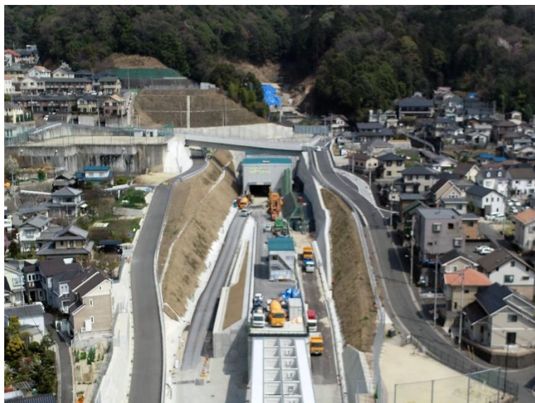
③ 高速5号線 NATM トンネル工事