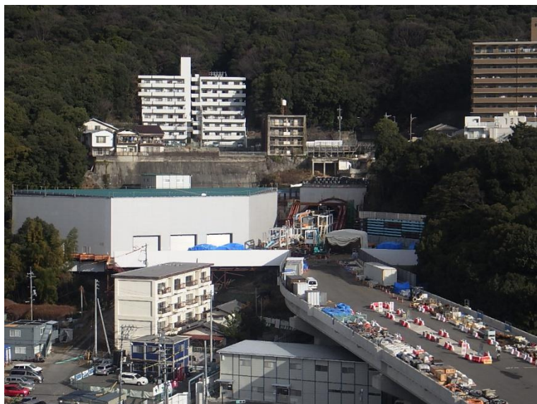
① 高速5号線シールドマシン製作他工事