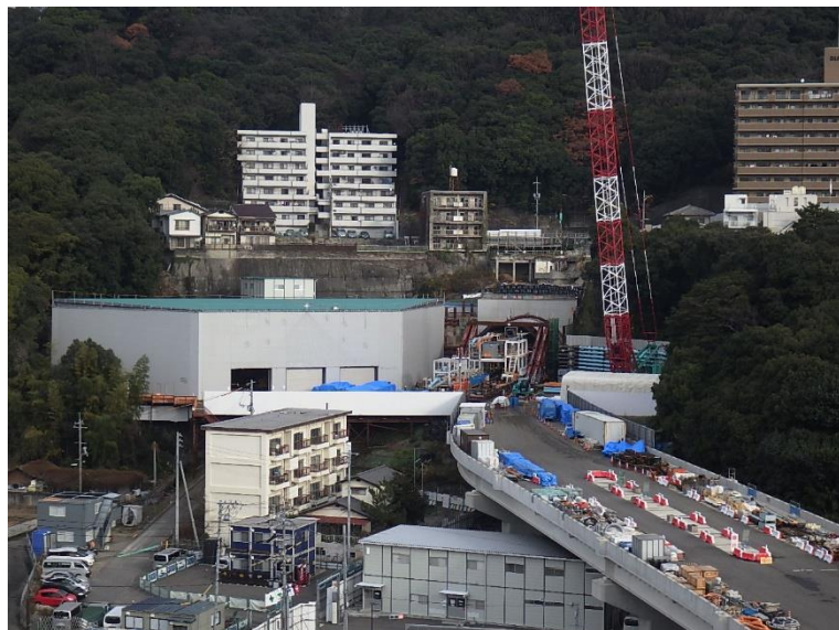
① 高速5号線シールドマシン製作他工事