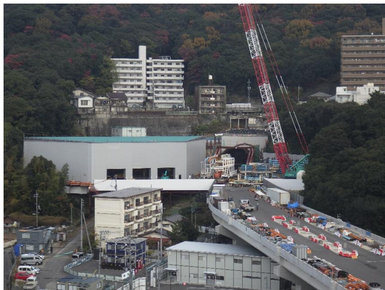
① 高速5号線シールドマシン製作他工事