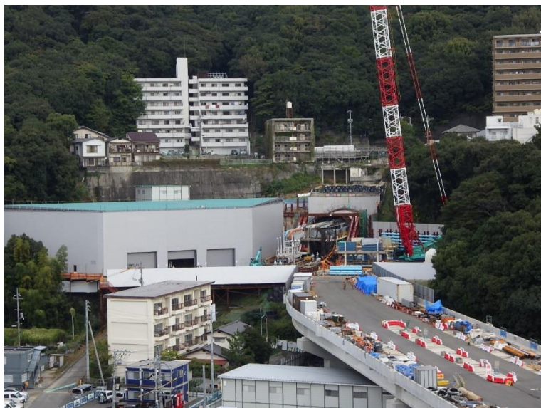
① 高速5号線シールドマシン製作他工事