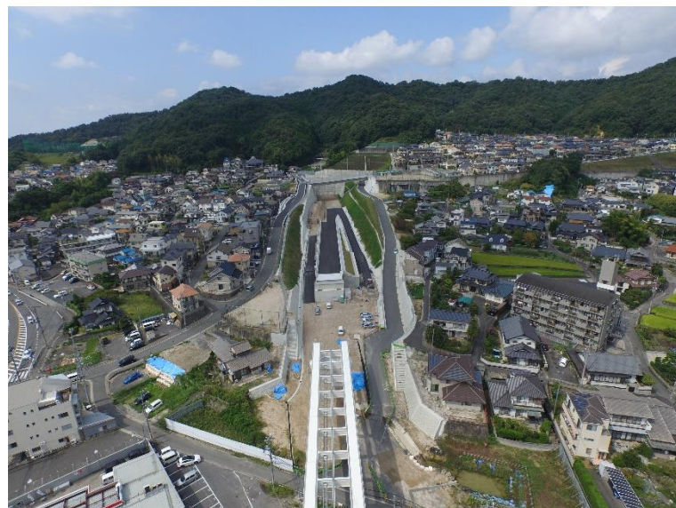
③ 高速5号線道路新設工事 (中山 I C)