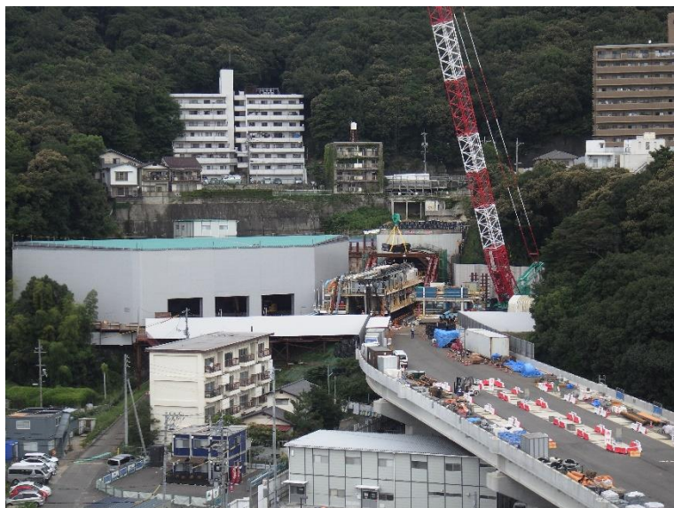
① 高速5号線シールドマシン製作他工事