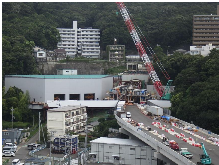
① 高速5号線シールドマシン製作他工事