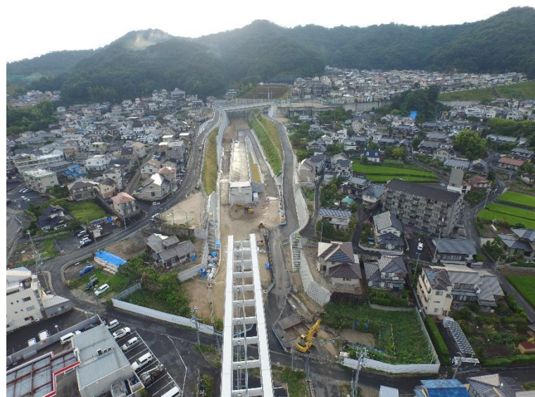
③ 高速5号線道路新設工事 (中山 I C)