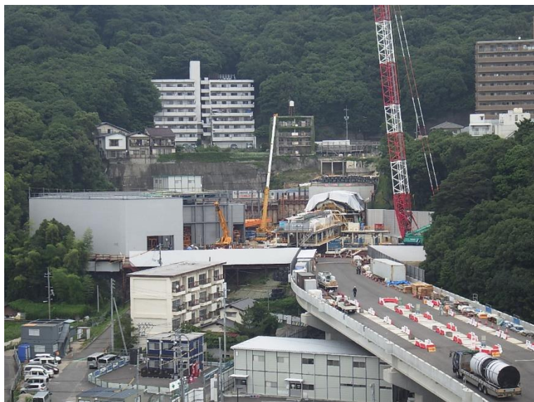
① 高速5号線シールドマシン製作他工事