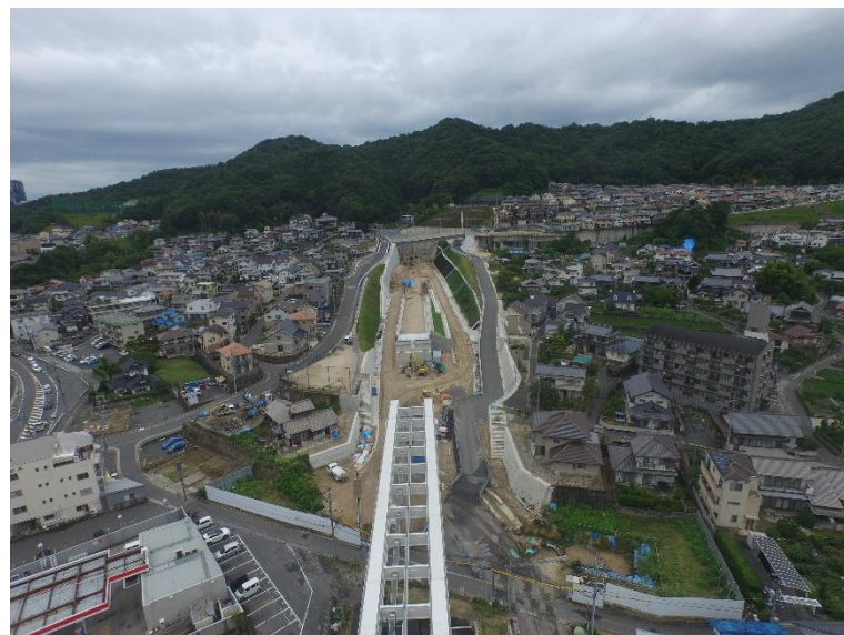
③ 高速5号線道路新設工事 (中山 I C)