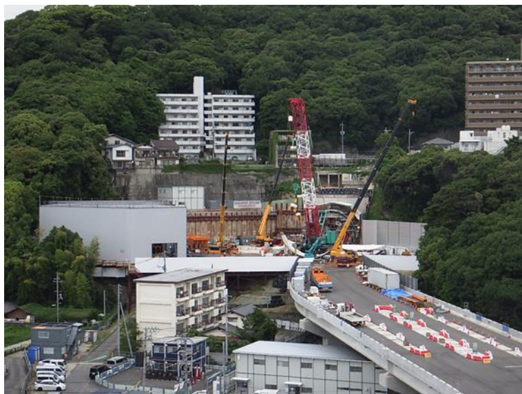
① 高速5号線シールドマシン製作他工事