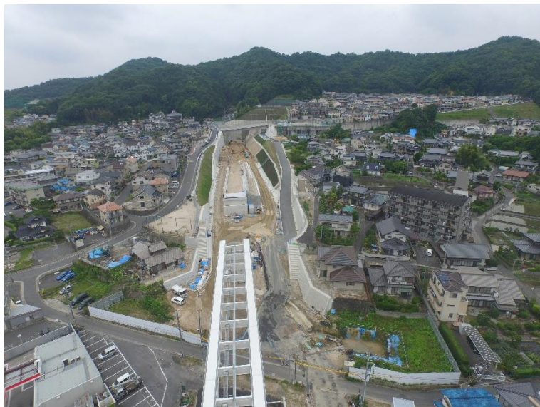
③ 高速5号線道路新設工事 (中山 I C)