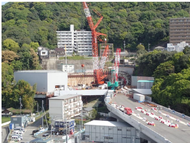
① 高速5号線シールドマシン製作他工事