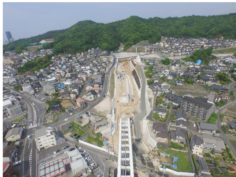
③ 高速5号線道路新設工事 (中山 I C)