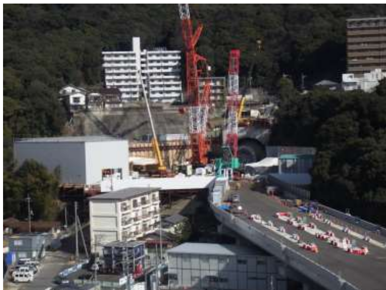
① 高速5号線シールドマシン製作他工事