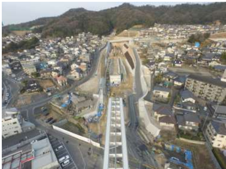
③ 高速5号線道路新設工事 (中山 I C)