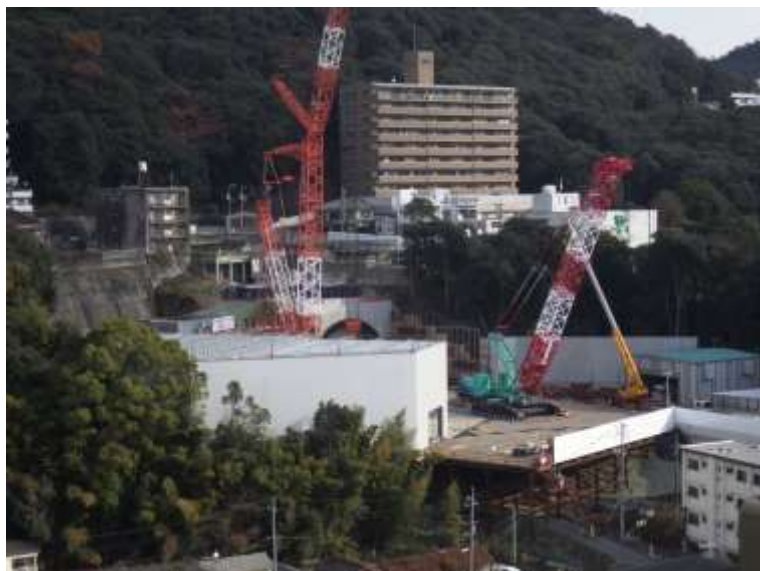
① 高速5号線シールドマシン製作他工事