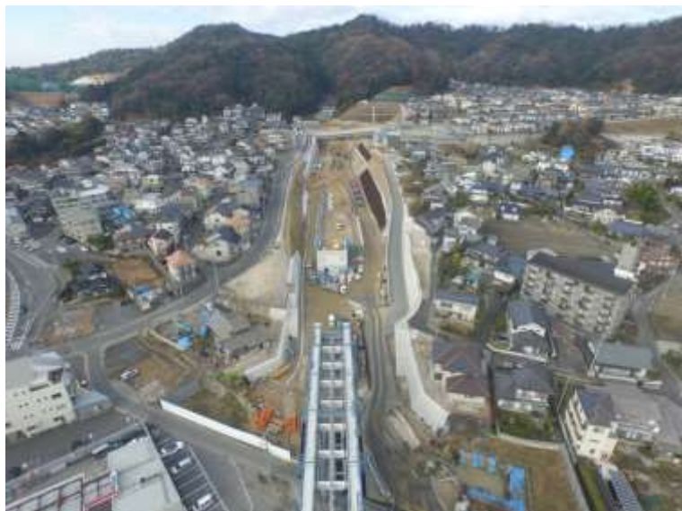
③ 高速5号線道路新設工事 (中山 I C)