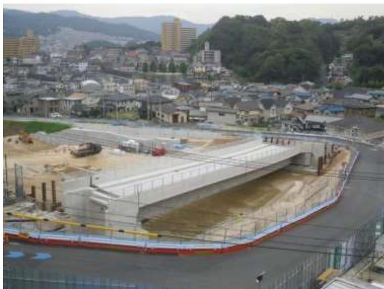
⑤ 中山地区跨道橋上部工事