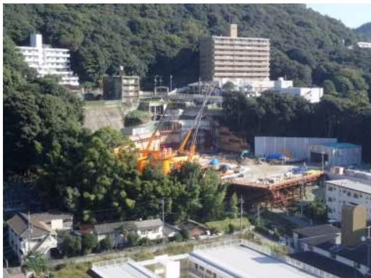
① 高速5号線シールドマシン製作他工事