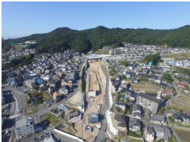
③ 高速5号線道路新設工事 (中山 I C)