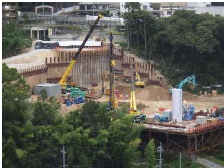
① 高速5号線シールドマシン製作他工事