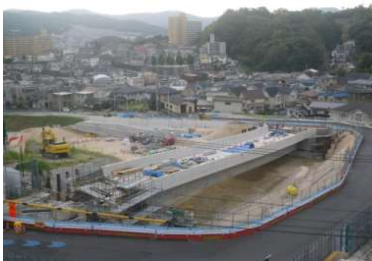
⑤ 中山地区跨道橋上部工事