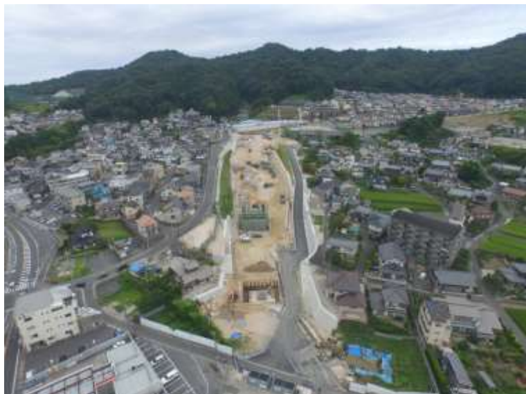
③ 高速5号線道路新設工事 (中山 I C)