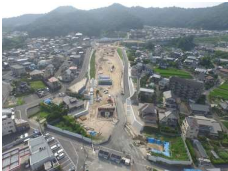
③ 高速5号線道路新設工事 (中山 I C)