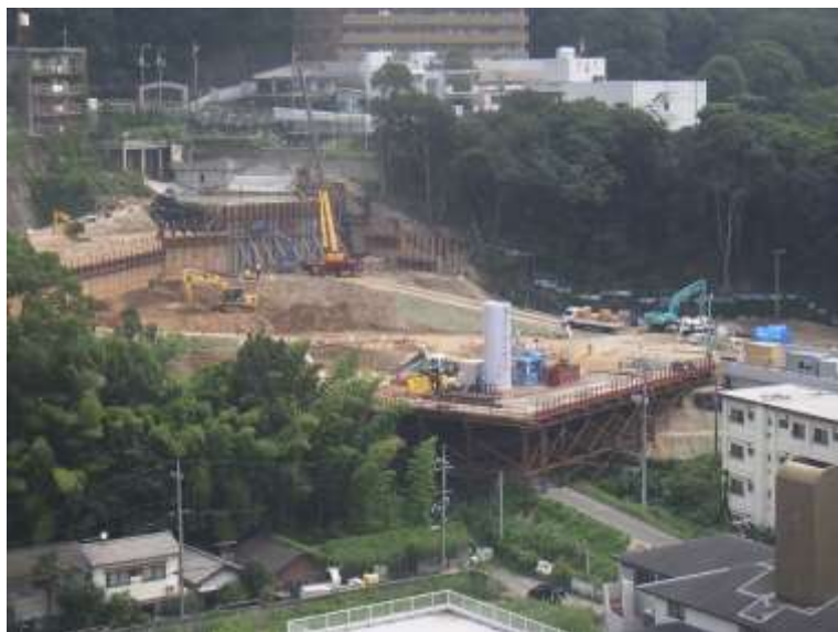
① 高速5号線シールドマシン製作他工事