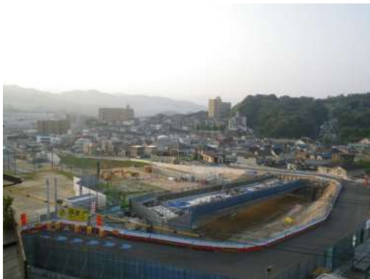
⑤ 中山地区跨道橋上部工事