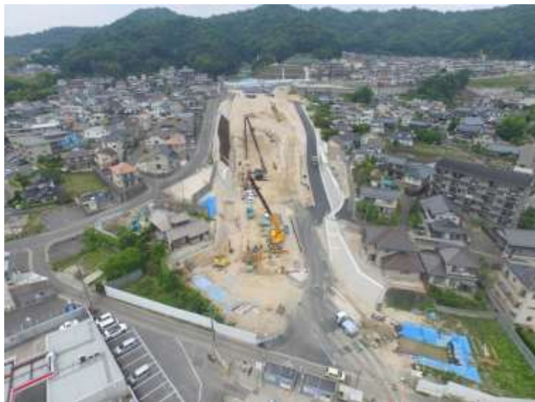
③ 高速5号線道路新設工事 (中山 I C)