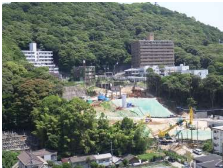
① 高速5号線シールドマシン製作他工事