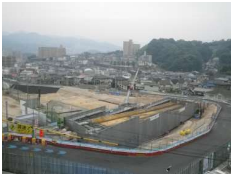
⑤ 中山地区跨道橋上部工事