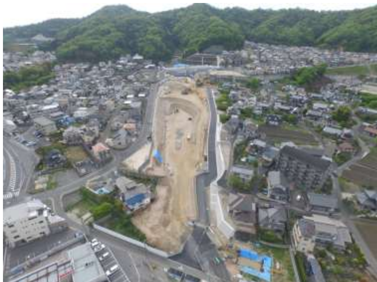
③ 高速5号線道路新設工事 (中山 I C)