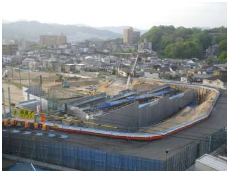
⑤ 中山地区跨道橋上部工事