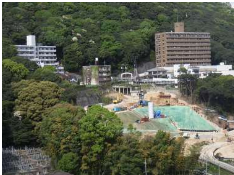
① 高速5号線シールドマシン製作他工事