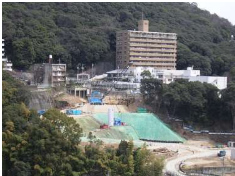
③ 高速5号線シールドマシン製作他工事