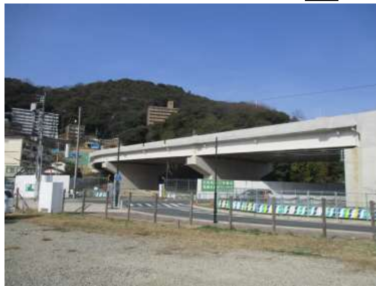
② 高速5号線鋼上部工事 (二葉の里) 完成