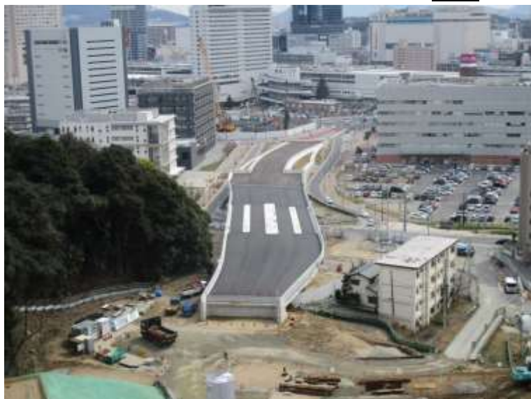
① 高速5号線鋼上部工事 (二葉の里) 完成