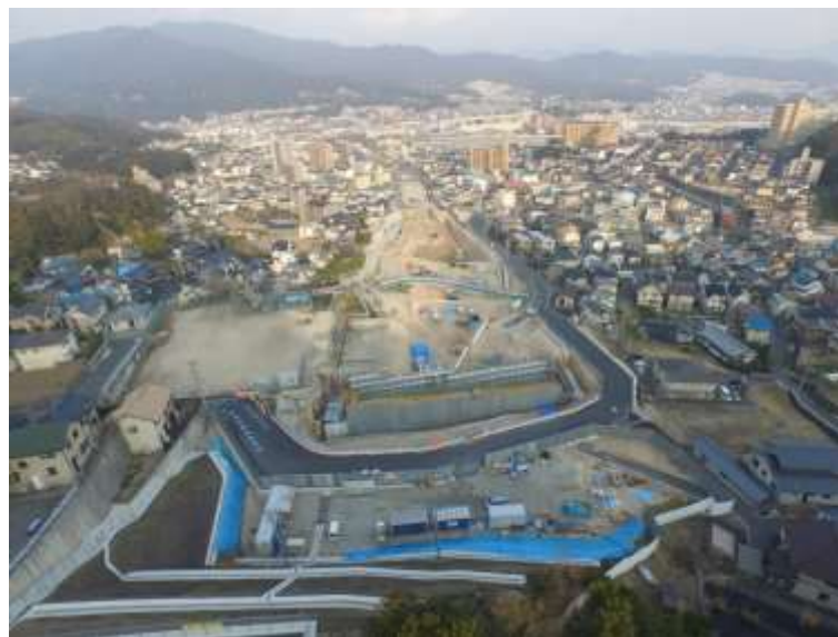
⑥ 高速5号線道路新設工事 (中山 I C)