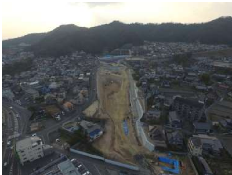
⑤ 高速5号線道路新設工事 (中山 I C)