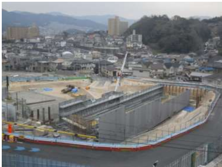
⑦ 中山地区跨道橋上部工事