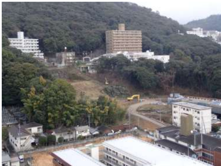
③ 高速5号線シールドマシン製作他工事