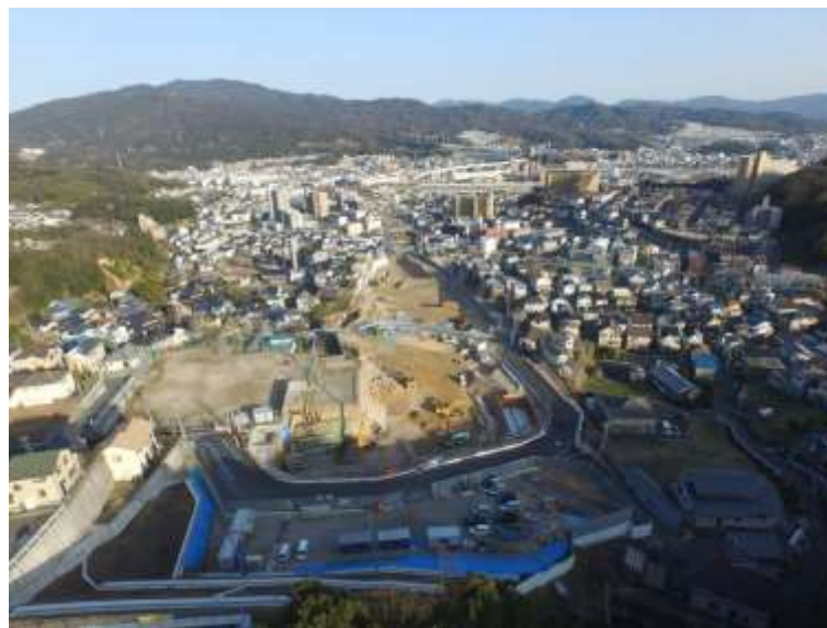
⑥ 高速5号線道路新設工事 (中山 I C)