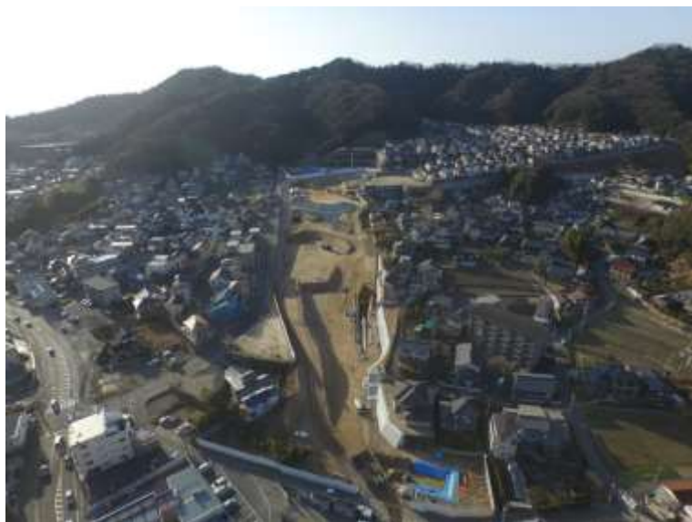
⑤ 高速5号線道路新設工事 (中山 I C)