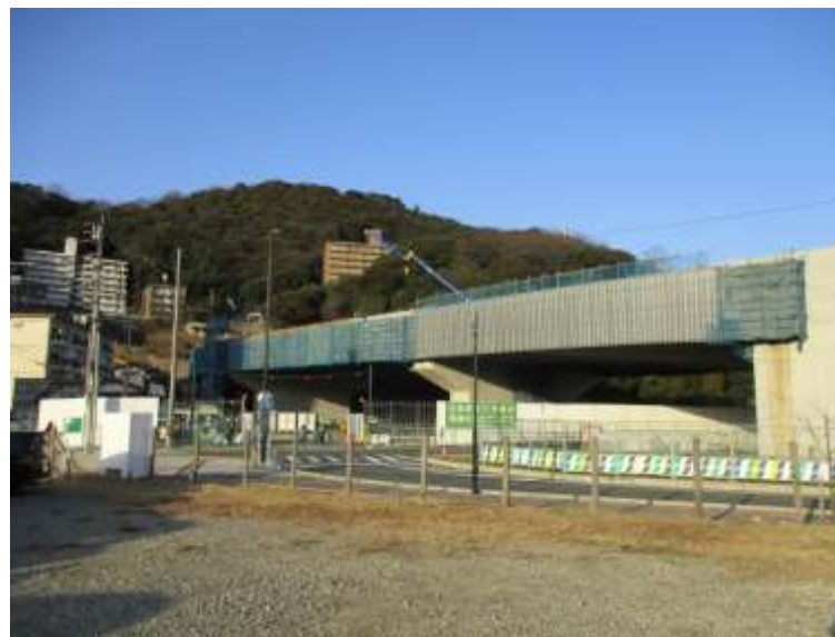
② 高速5号線鋼上部工事 (二葉の里)