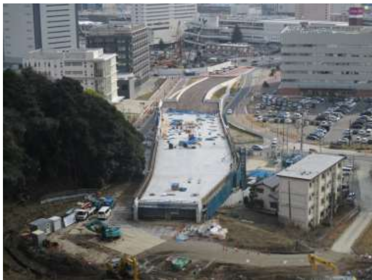
① 高速5号線鋼上部工事 (二葉の里)