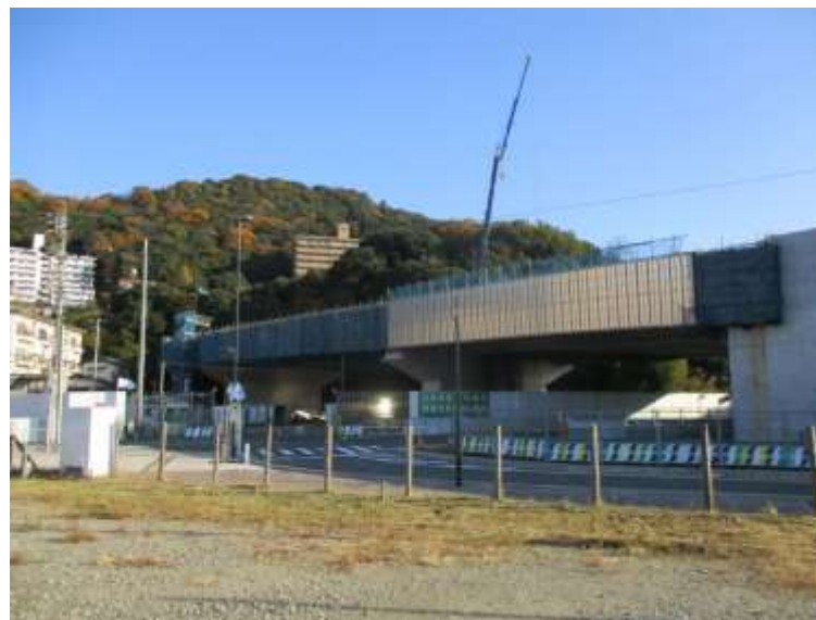
② 高速5号線鋼上部工事 (二葉の里)