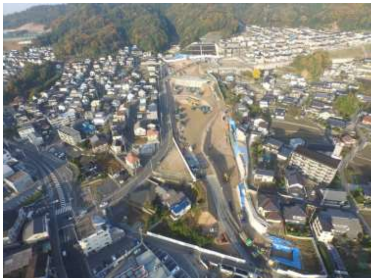
③ 高速5号線道路新設工事 (中山 I C)