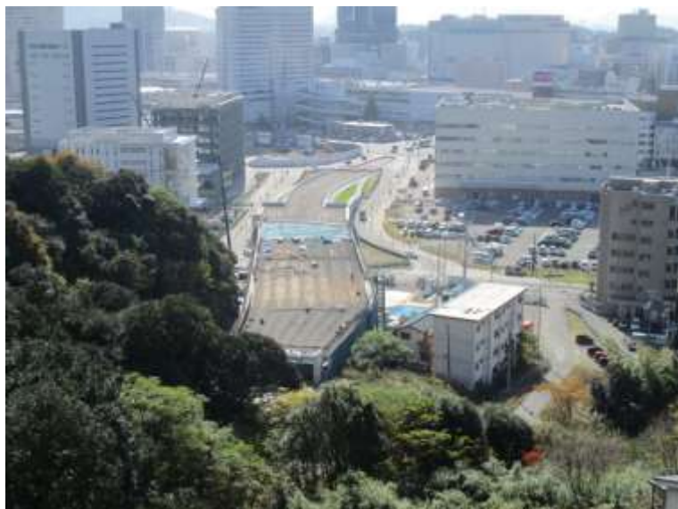
① 高速5号線鋼上部工事 (二葉の里)