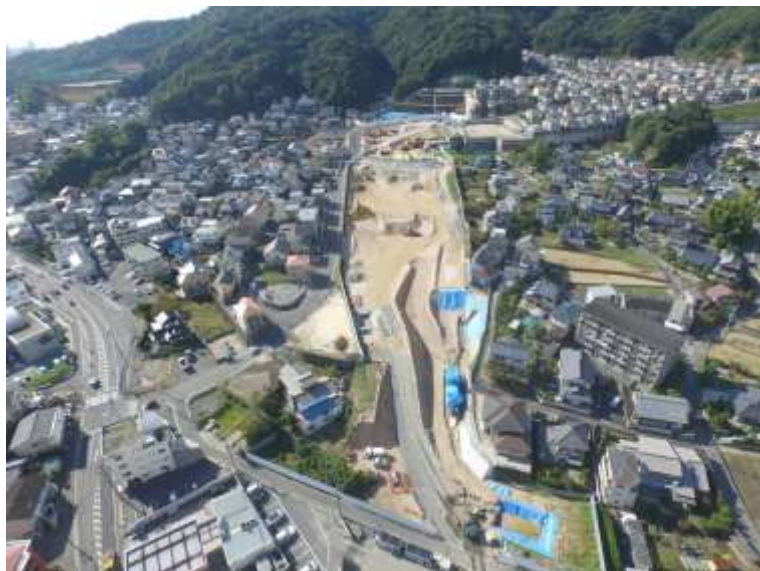
③ 高速5号線道路新設工事 (中山 I C)