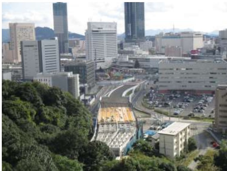
① 高速5号線鋼上部工事 (二葉の里)