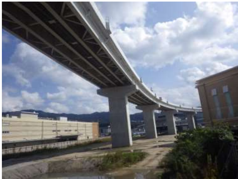
⑤ 高速5号線鋼上部工事 (温品JCT)