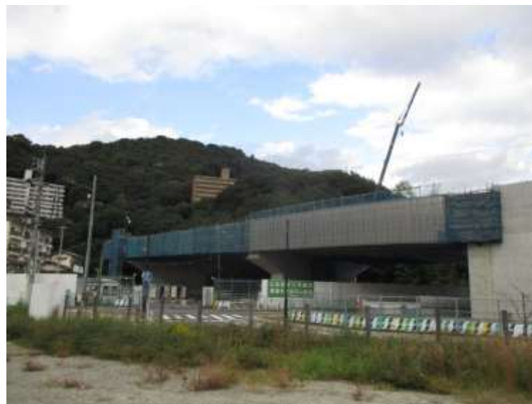
② 高速5号線鋼上部工事 (二葉の里)