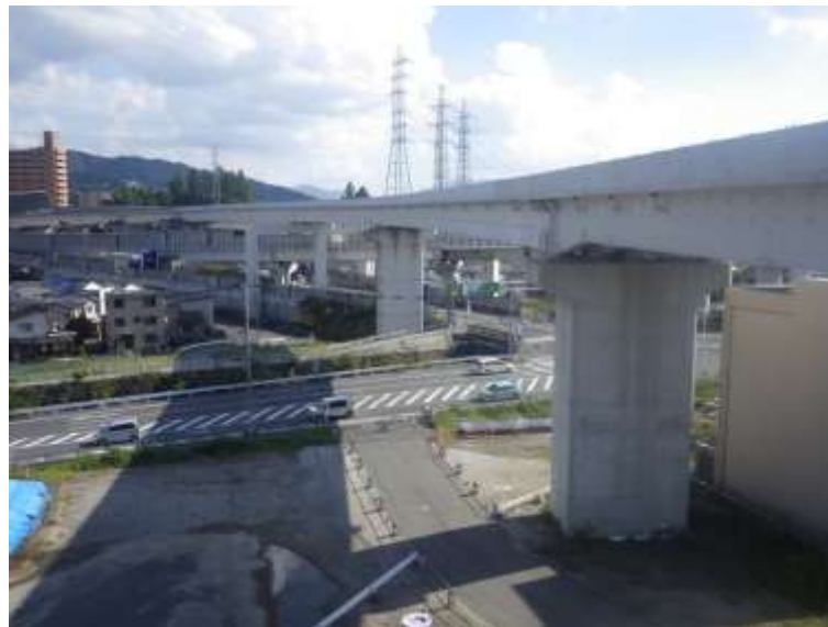
⑥ 高速5号線鋼上部工事 (温品JCT)