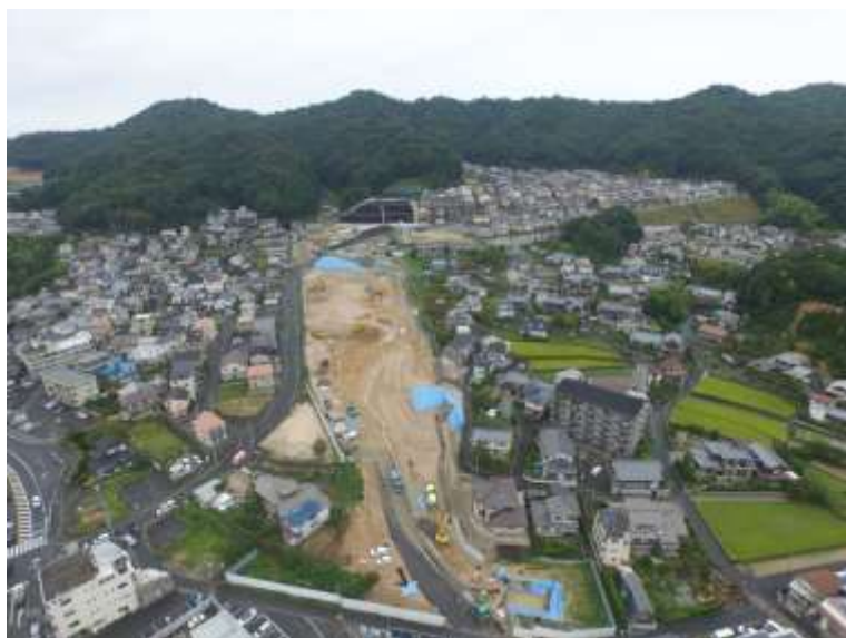
⑦ 高速5号線道路新設工事 (中山 IC)