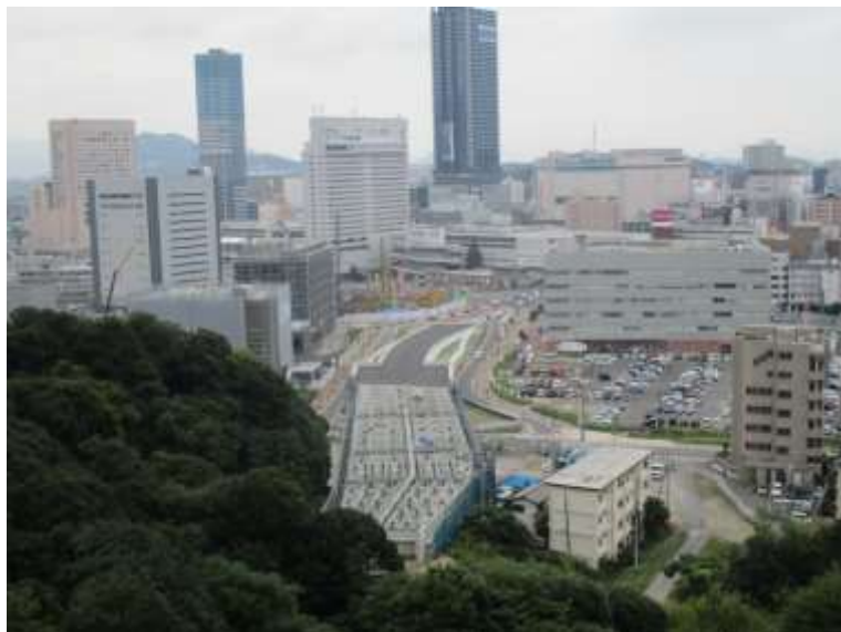
③ 高速5号線鋼上部工事 (二葉の里)