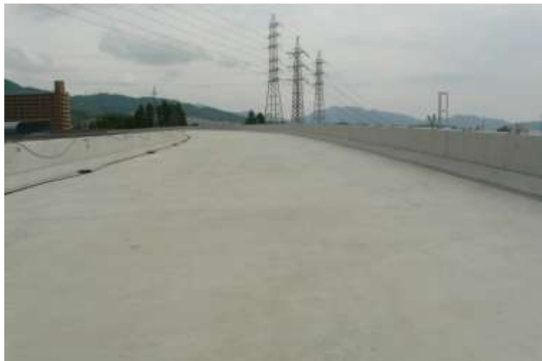
⑤ 高速5号線鋼上部工事 (温品 JCT)