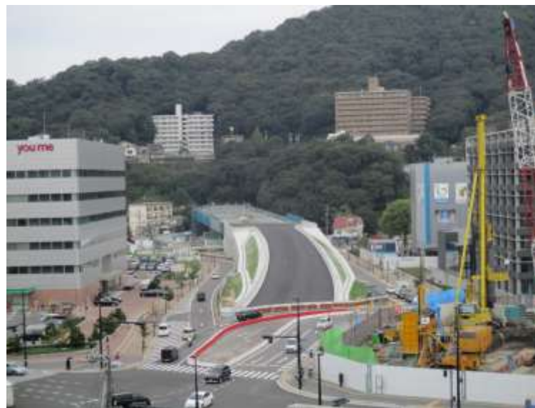
② 高速5号線下部工事 (二葉の里)