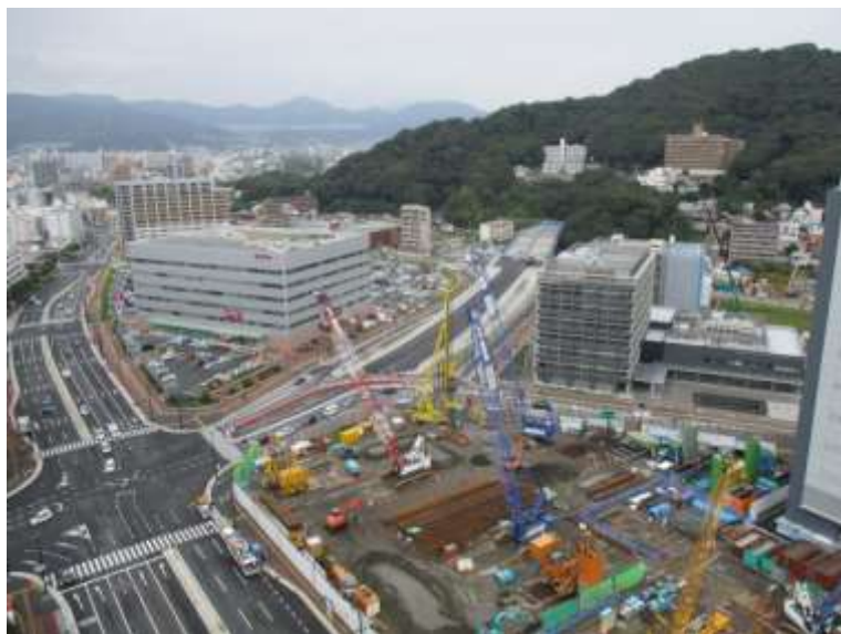
① 高速5号線下部工事 (二葉の里)