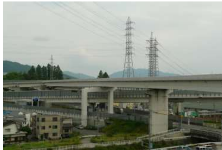
⑥ 高速5号線鋼上部工事 (温品 JCT)