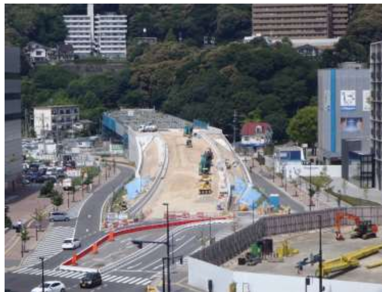
② 高速5号線下部工事 (二葉の里)