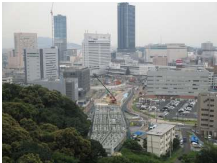
③ 高速5号線鋼上部工事 (二葉の里)