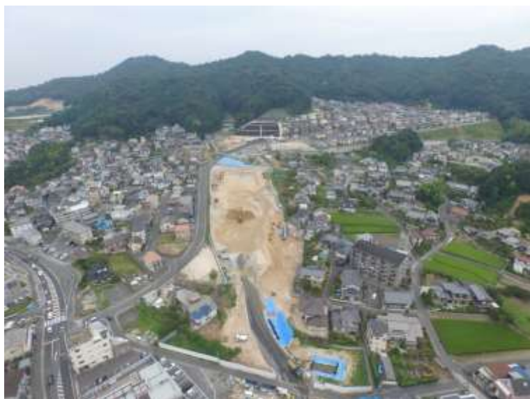
⑦ 高速5号線道路新設工事 (中山 IC)