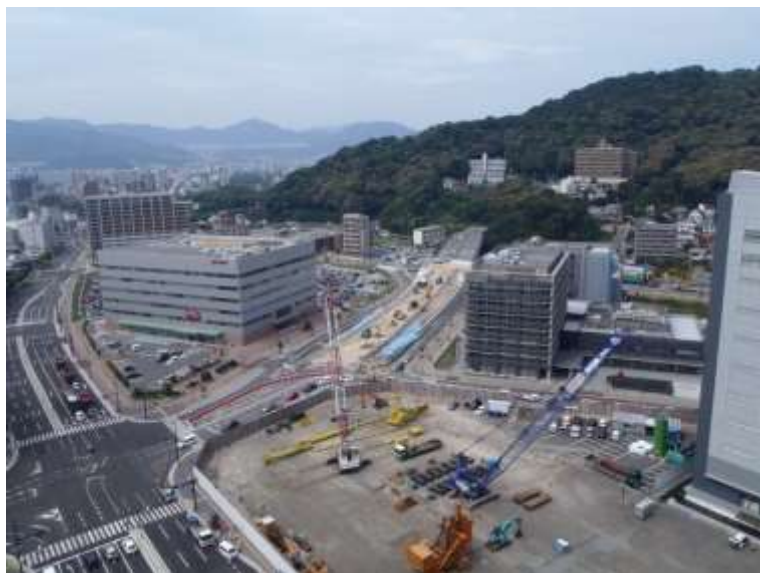
① 高速5号線下部工事 (二葉の里)