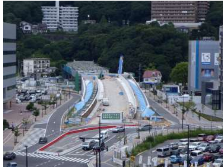
② 高速5号線下部工事 (二葉の里)