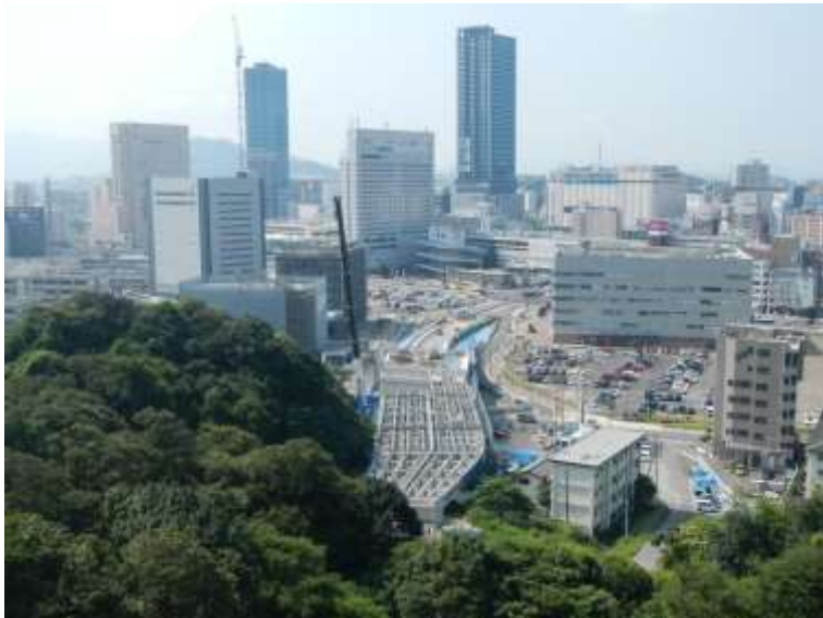
③ 高速5号線鋼上部工事 (二葉の里)