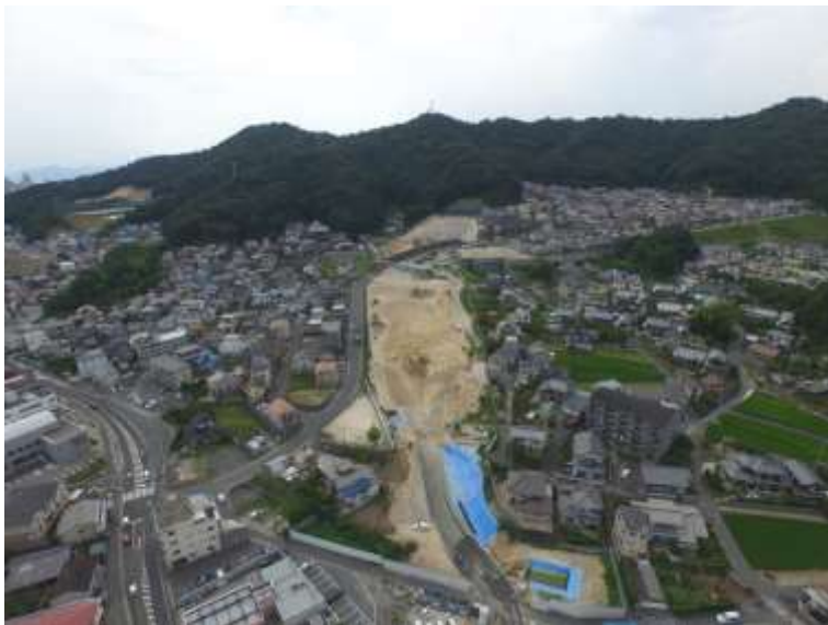
⑦ 高速5号線道路新設工事 (中山 IC)