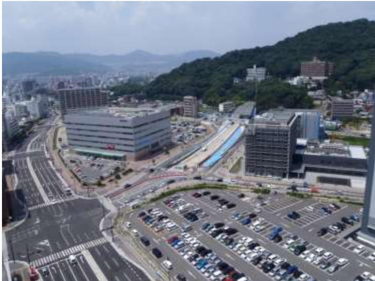
① 高速5号線下部工事 (二葉の里)