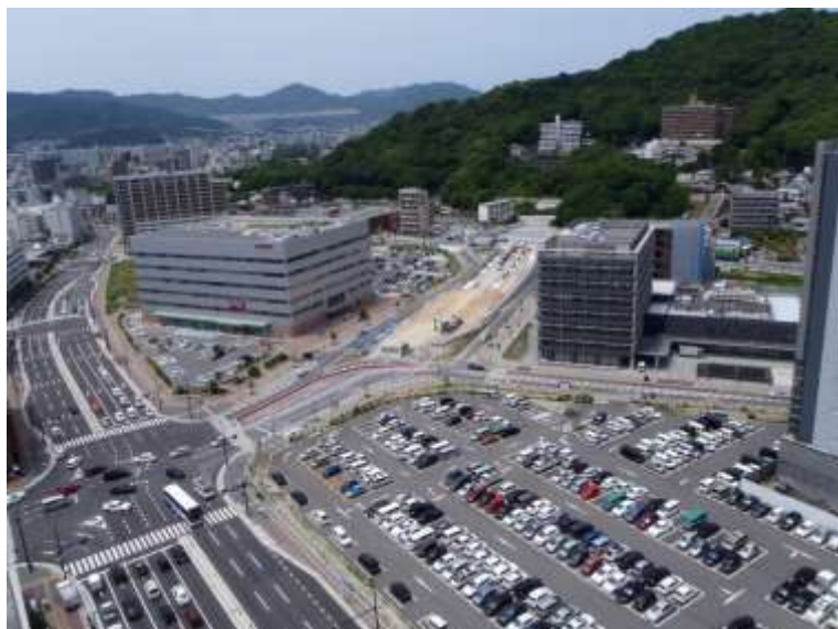
① 高速5号線下部工事 (二葉の里)