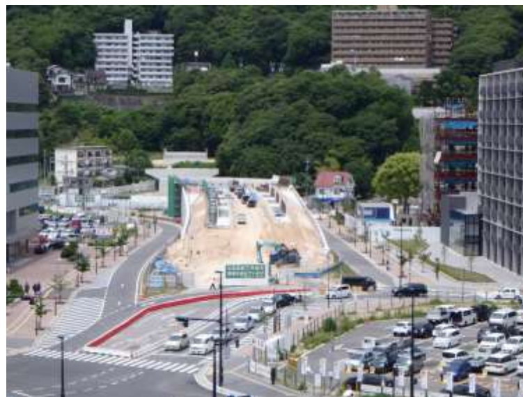
② 高速5号線下部工事 (二葉の里)