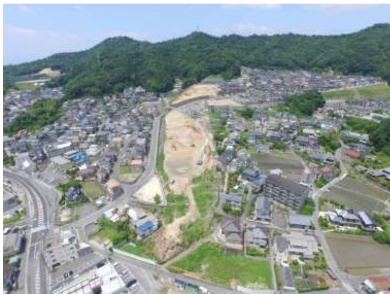
⑤ 高速5号線道路新設工事 (中山IC)