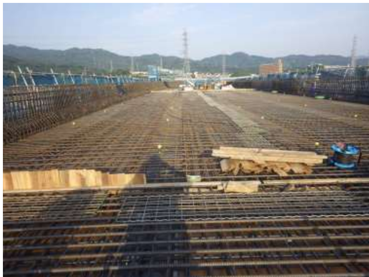
③ 高速5号線鋼上部工事 (温品 JCT)