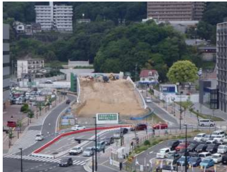
② 高速5号線下部工事 (二葉の里)