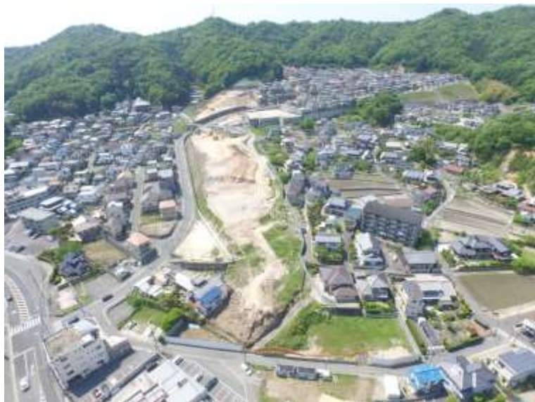
⑤ 高速5号線道路新設工事 (中山IC)