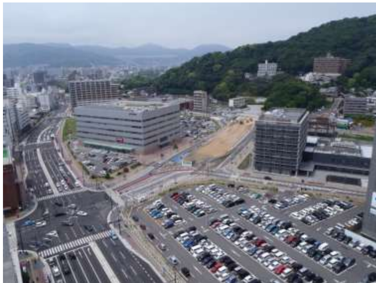
① 高速5号線下部工事 (二葉の里)