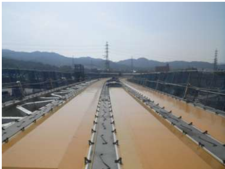
③ 高速5号線鋼上部工事 (温品 JCT)