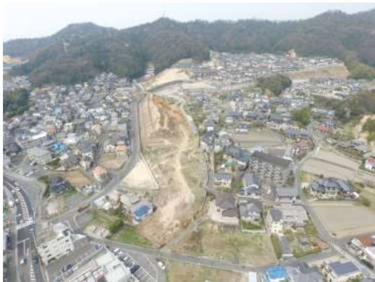
⑤ 高速5号線道路新設工事 (中山 IC)