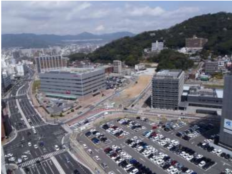
① 高速5号線下部工事 (二葉の里)