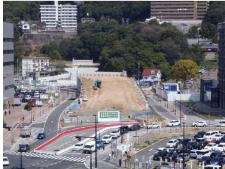
② 高速5号線下部工事 (二葉の里)