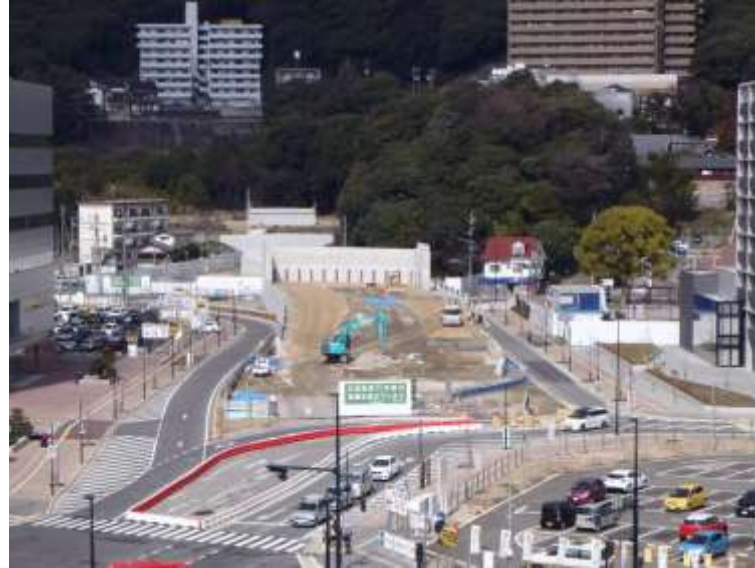
② 高速5号線下部工事 (二葉の里)