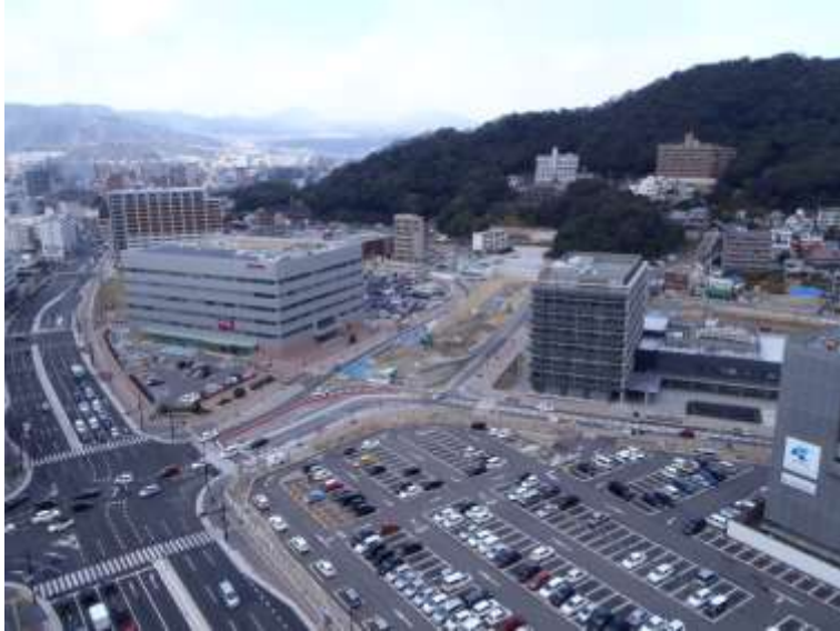
① 高速5号線下部工事 (二葉の里)