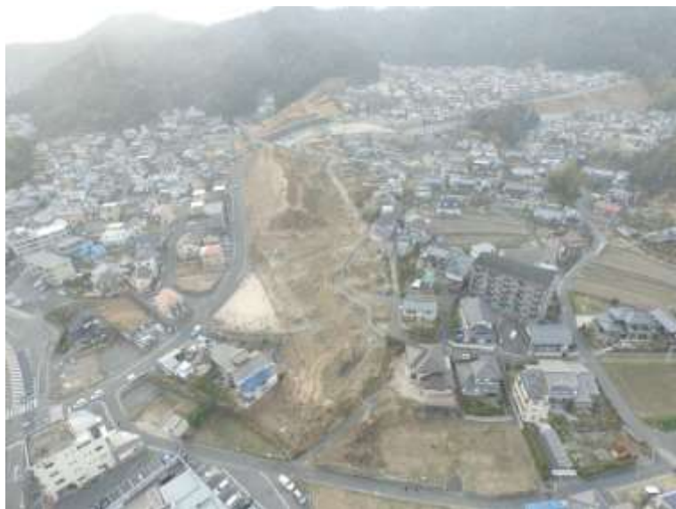
⑤ 高速5号線道路新設工事 (中山 IC)