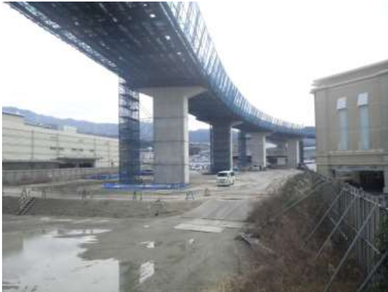
③ 高速5号線鋼上部工事 (温品 JCT)