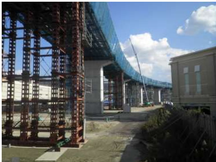
③ 高速5号線鋼上部工事 (温品 JCT)