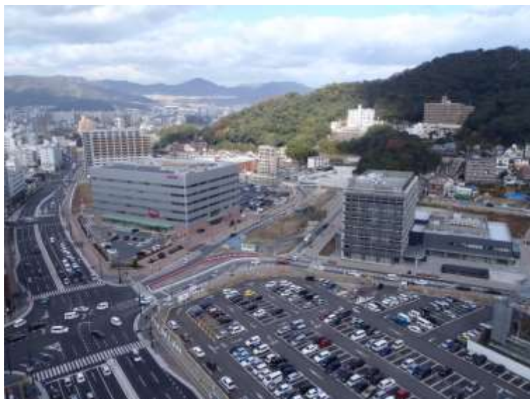
① 高速5号線下部工事 (二葉の里)