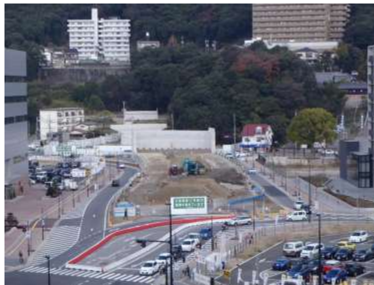
② 高速5号線下部工事 (二葉の里)