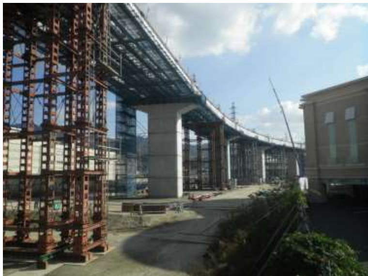
③ 高速5号線鋼上部工事 (温品 JCT)