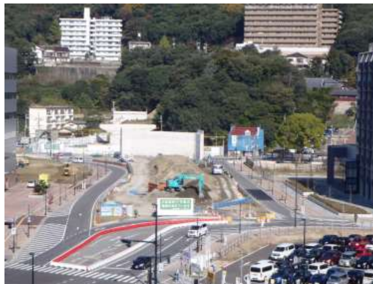
② 高速5号線下部工事 (二葉の里)