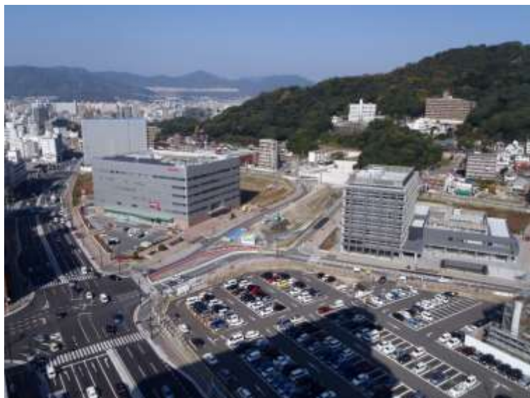
① 高速5号線下部工事 (二葉の里)