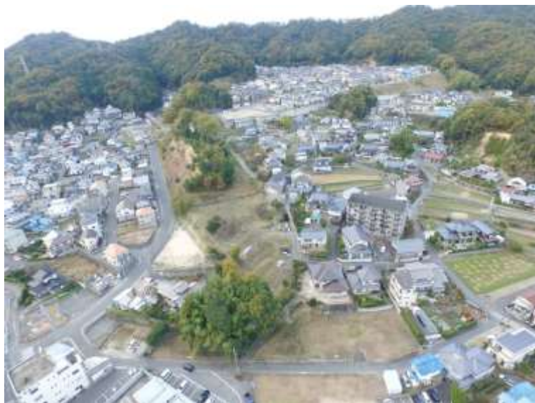
⑤ 高速5号線道路新設工事 (中山 IC)