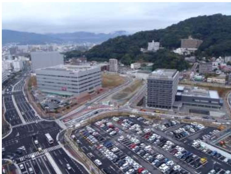
① 高速5号線下部工事 (二葉の里)