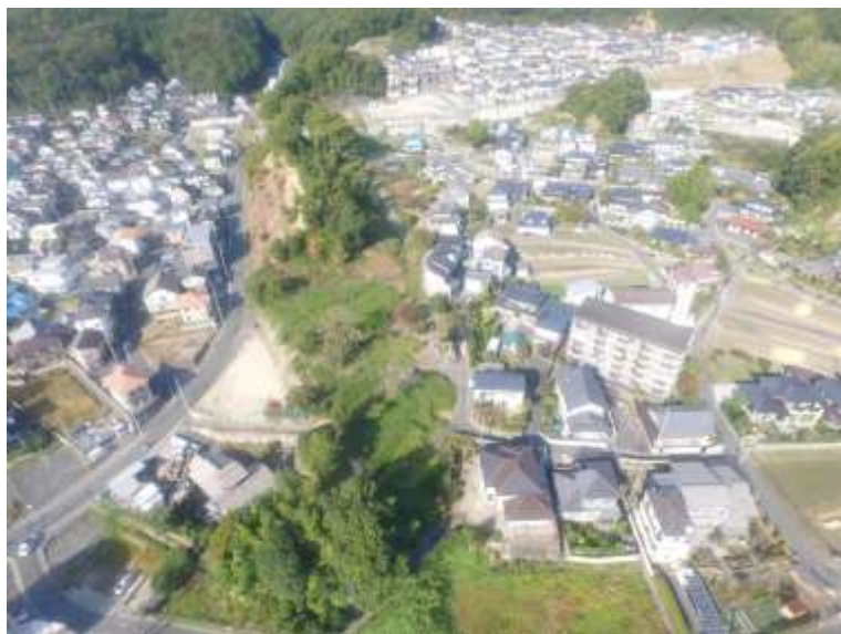
⑤ 高速5号線道路新設工事 (中山 IC)