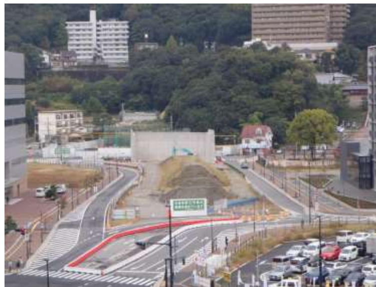
② 高速5号線下部工事 (二葉の里)