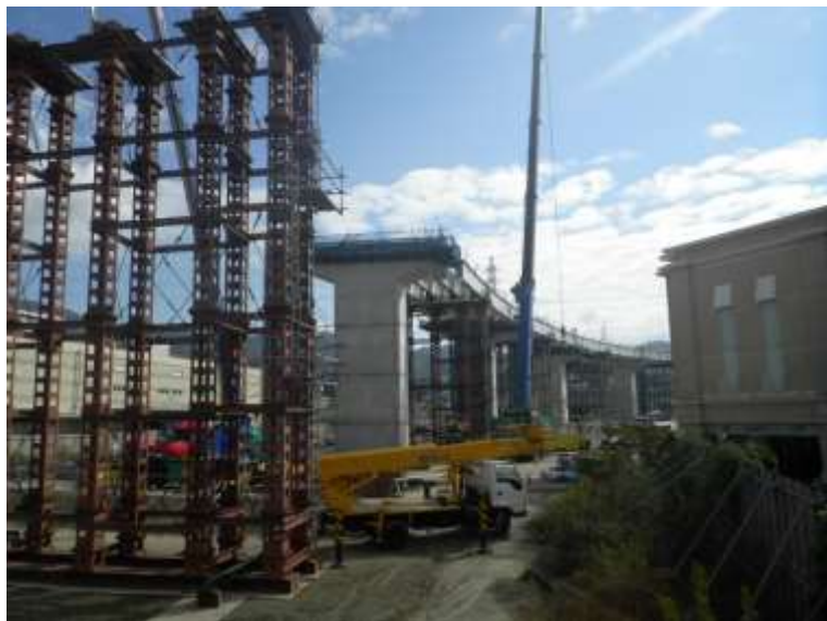
③ 高速5号線鋼上部工事 (温品JCT)