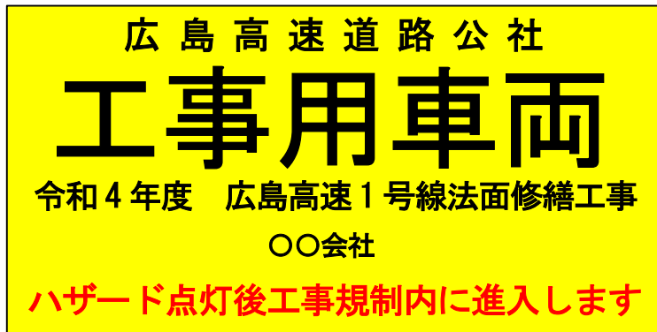
大型車用車両幕 例