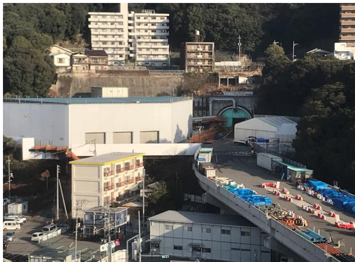
① 高速 5 号線シールドトンネル掘削他工事