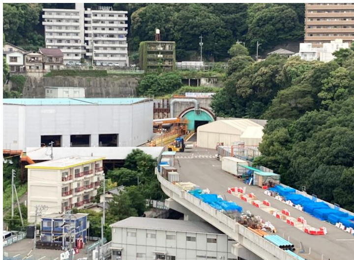
① 高速 5 号線シールドトンネル掘削他工事